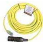
262619 Cable de extensión