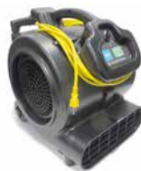
TE9014819 Abanico de Motor