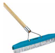
263499 Rastrillo de alfombra