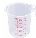
2701281 Taza medidora