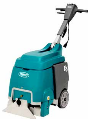
TE9004194 Extractor de bajo perfil Tennant E5

Solicite sus suministros de limpieza directamente con Maintex • Visítenos en línea en maintex.com